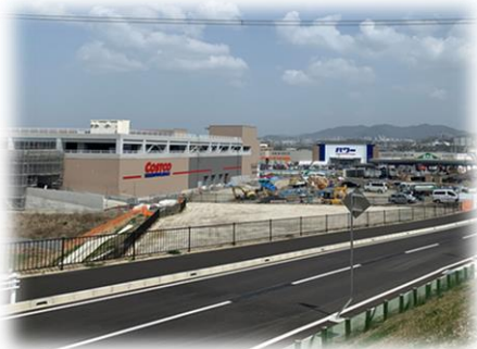
工事進捗状況(R3.3 末時点)