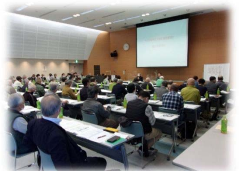
第60回総代会の様子