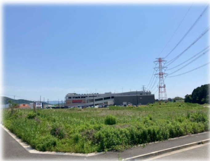
B-1ブロック用地Cの状況

大規模商業保留地についての現状と今後の対応について説明しました。未売却の土地(B-1ブロック用地C)については、優先交渉権者であるコストコの契約締結に向け、取り組んでまいります。