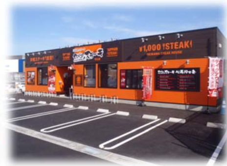
やっぱりステーキ