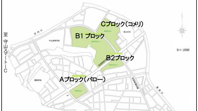
大規模商業施設街区位置図