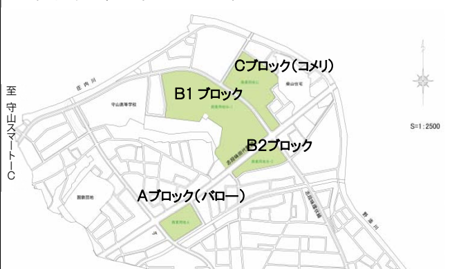
大規模商業施設街区位置図