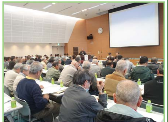
第47回総代会の様子