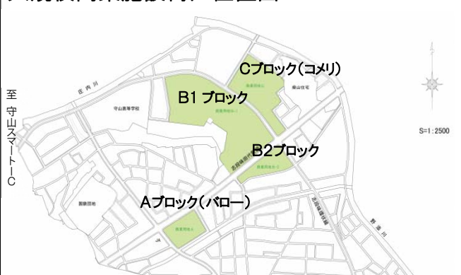
大規模商業施設街区位置図